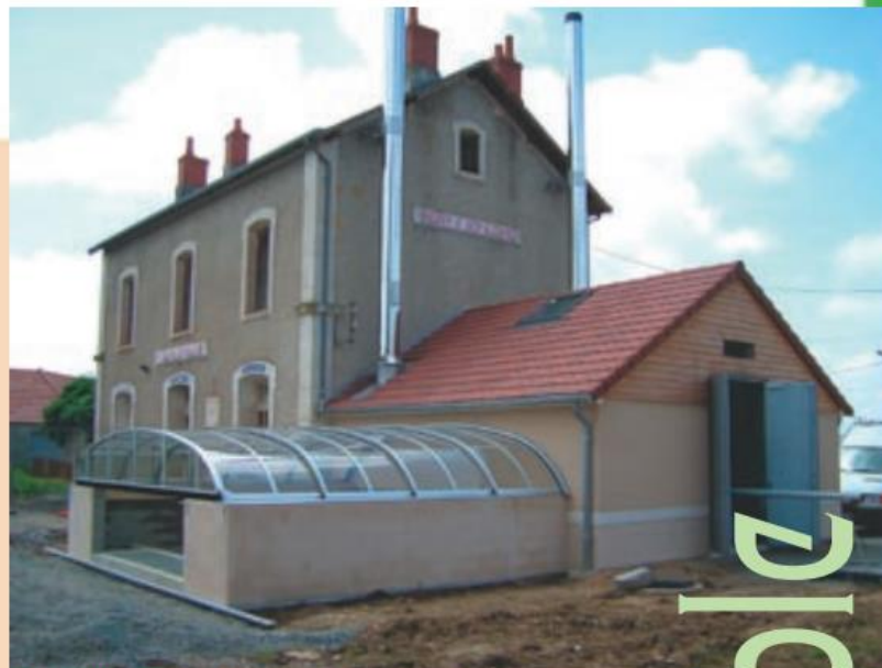
La chaufferie adossée à l'ancienne gare.