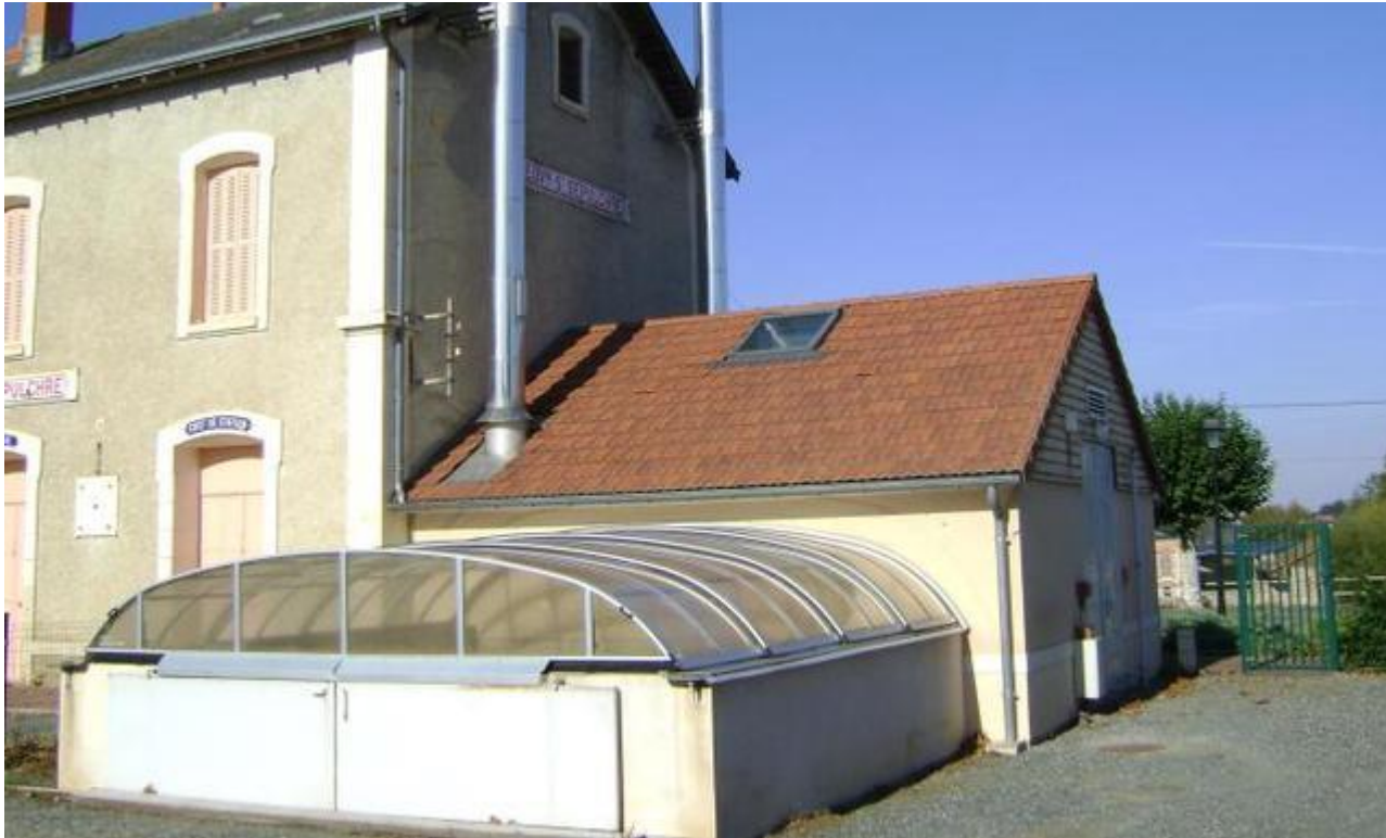
La chaudière est arrivée à saturation.

La commune possède un réseau de chaleur, avec une chaudière alimentée par du bois provenant de la région d'Aigurande.